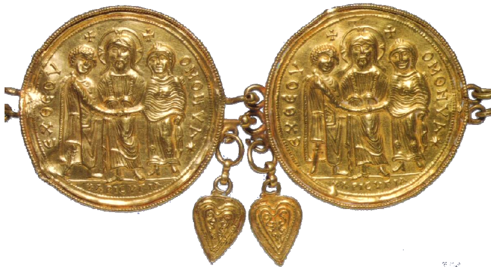
Christus verbindet die Hände der Brautleute ("Dextrarum Iunctio") (Hochzeitsgürtel, Gold, frühbyzantinisch, Konstantinopel, 6.-7. Jahrhundert)